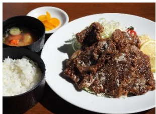
シカ竜田揚げ定食

カキフライ、ご飯、味噌汁、サラダ、香物 「北の恵み愛食レストラン」認定メニュー 980kcal ※根室湾中部漁協産カキ使用